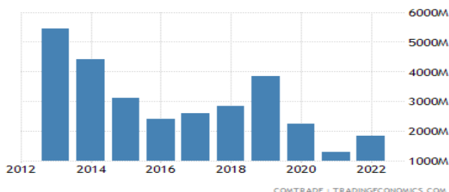
شکل ۱: صادرات هند به ایران

هند مهم‌ترین شریک ایران در زمینه سرمایه‌گذاری در زیرساخت‌های بندر چابهار است. در همین راستا در ماه مه سال ۲۰۱۶، مودی نخست‌وزیر هند ضمن بازدید از ایران در مورد تجدید همکاری با ایران درباره همکاری اقتصادی، توسعه زیرساخت‌ها و مبادلات فرهنگی گفتگو کرد. مهم‌ترین جنبه دیدار مودی، نتیجه‌گیری توافق سه جانبه با افغانستان برای توسعه بندر چابهار بود که هندوستان را از طریق عبور از پاکستان به افغانستان می‌رساند. سرمایه‌گذاری هند در چابهار حدود ۵۰۰ میلیون دلار تخمین زده می‌شود و شامل تأسیس یک منطقه اقتصادی ویژه و کارخانه‌های متعدد است که می‌تواند با سوخت‌های ایرانی با نرخ تخفیف اجرا شود (Bearak & Murphy, 2016). در مجموع، راه ترانزیتی بندر چابهار مسیری امن‌تر، به‌صرفه‌تر و کوتاه‌تر برای تجارت هند به‌جای مسیر پاکستان است. یادآوری می‌شود که هند از رابطه با ایران به‌دنبال یک ایجاد دالان شمال به جنوب به‌ویژه یک مسیر تجاری بین آسیای مرکزی و بندر چابهار است. موضوع انتقال گاز ایران از مسیر پاکستان (یا خلیج فارس و دریای عربی) به هند بسیار